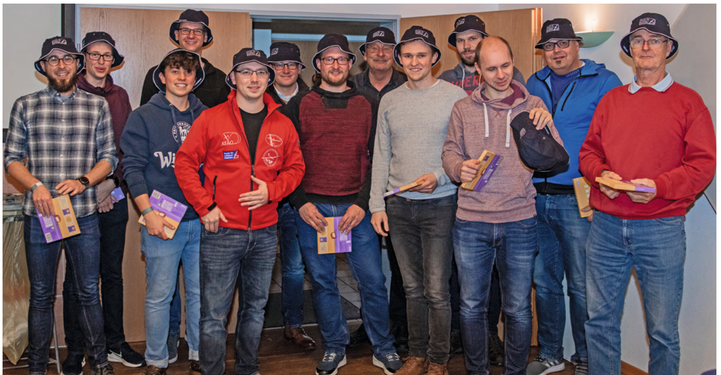
Fusionsvorstände der Luftsportvereinigung Altkreis-Isenhagen und vom Flugtechnischen Verein Metzingen

Mit Blick auf die Zielgruppen des Vereins wurde u. a. ein Flugzeugpark (Konzept „für Jedermann“) entwickelt. Aus insgesamt zehn gemeinsamen Flug-