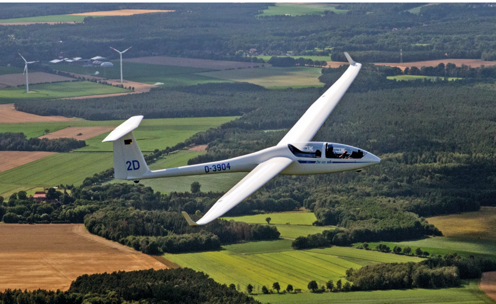
DG-505 über dem Flugplatz Berliner Heide, im Landkreis Celle

Nun galt es, einen neuen Namen für den Verein zu finden. Schließlich sollte nicht nur für den aktiven Teil ein neuer Verein geformt werden, sondern für alle Mitglieder. Insgesamt gab es zehn Namensvorschläge und zwei Abstimmungsrounds. Letztendlich wurde zwischen zwei Favoriten entschieden und Anfang Oktober 2021 machte der Name „Verein für Luftsport Südheide“ mit einer 80-Prozent-Mehrheit das Rennen.